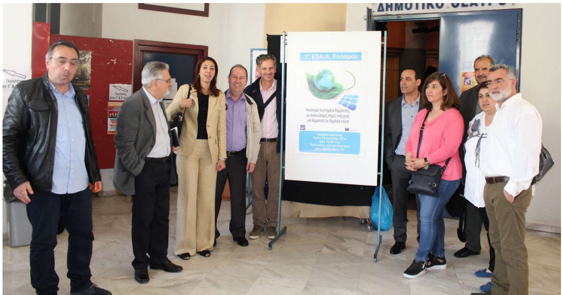
Οι καθηγητές του 1 ου ΕΠΑΛ και οι Διευθυντές των σχολείων