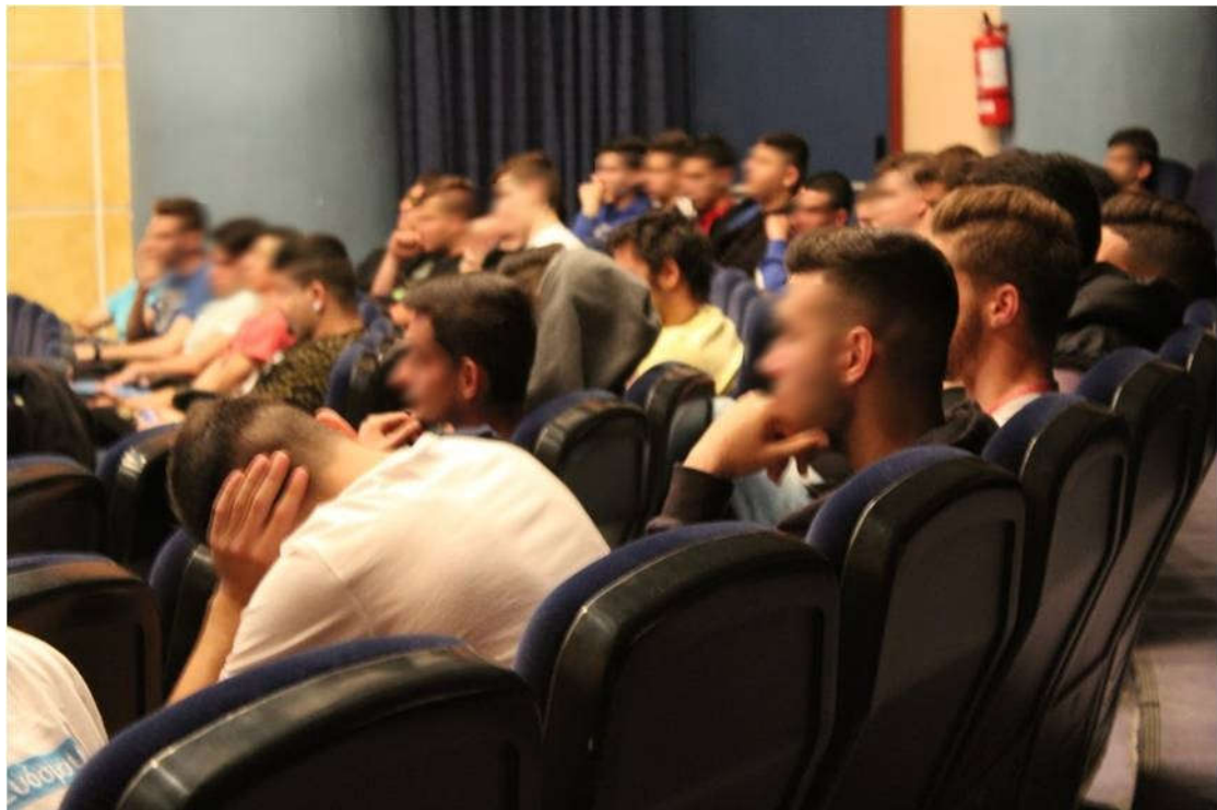
Οι μαθητές του 1 ου ΕΠΑΛ παρακολουθούν την Ημερίδα

Καθ' όλη τη διάρκεια της ημέρας οι μαθητές του Τομέα Μηχανολογίας ενημέρωναν τους δημότες στους κεντρικούς δρόμους της πόλης του Ευόσμου, με ειδικά έντυπα που δημιουργήθηκαν για το σκοπό αυτό, για τις ευεργεσίες των ανανεώσιμων πηγών ενέργειας.